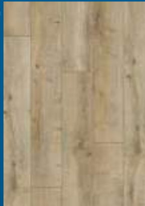
52349 dąb Soft Brown