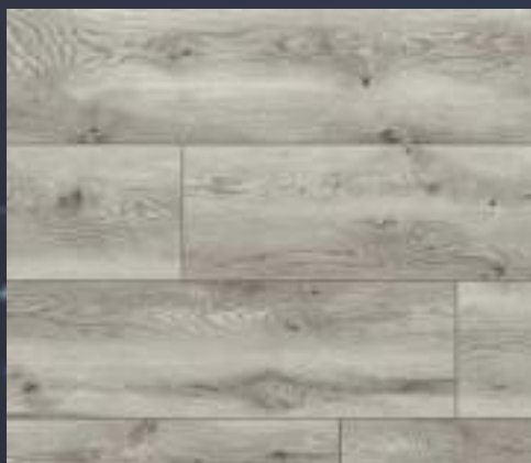
50857 dąb Diestro