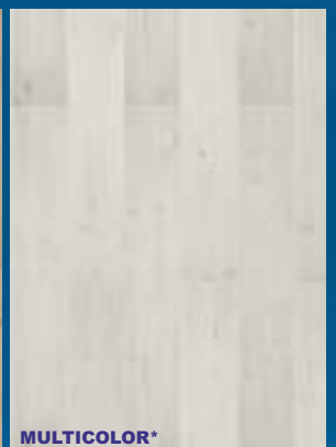
52375 dąb Light Brown MIX