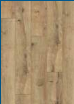
52345 dąb Light Natural