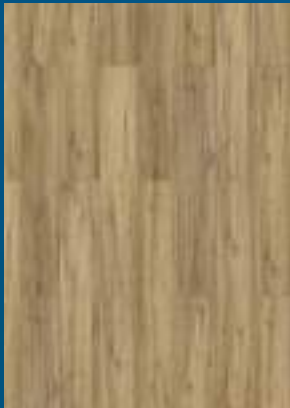
52344 dąb Natural

1286mm x 192mm x 8mm opakowanie: 1,974m 2 / paleta: 94,752m 2