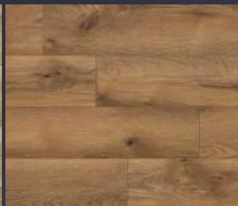
50672 dąb Venti