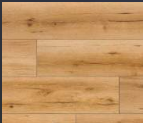
48275 dąb Cassano

1286mm x 282mm x 8mm opakowanie: 2,176m 2 / paleta: 69,632m 2