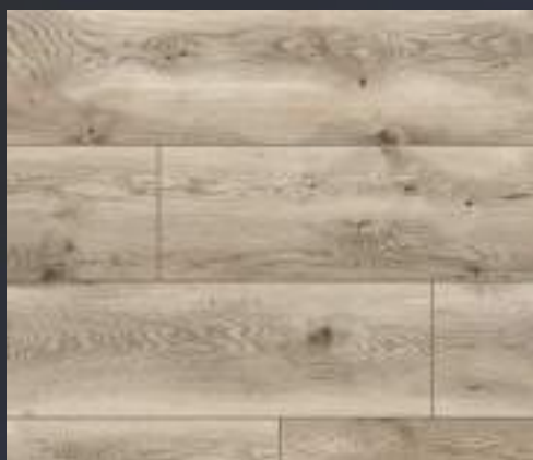
50858 dąb Regio