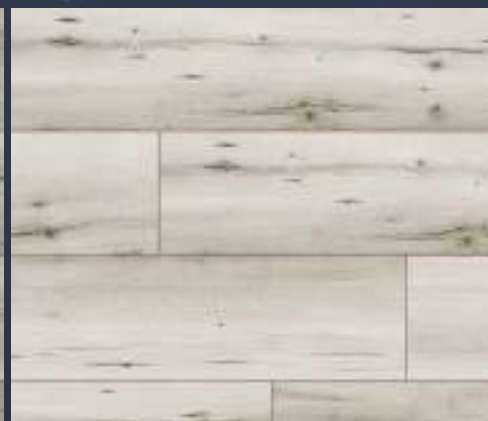
50841 dąb Hers