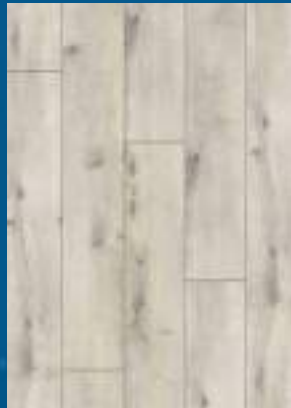
52348 dąb Creme