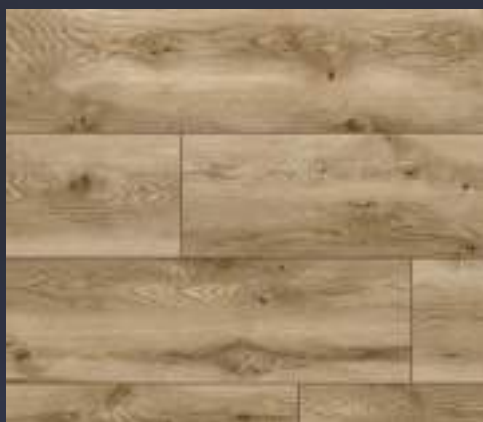
50674 dąb Teramo