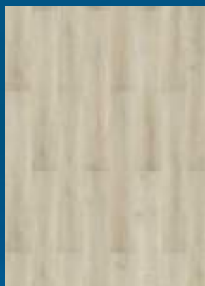
52355 dąb Creme Natural